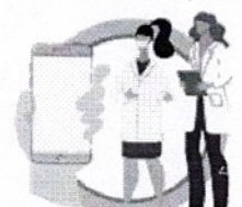
В СЛУЧАЕ ЗАБОЛЕВАНИЯ ОБРАЩАЙТЕСЬ К ВРАЧУ